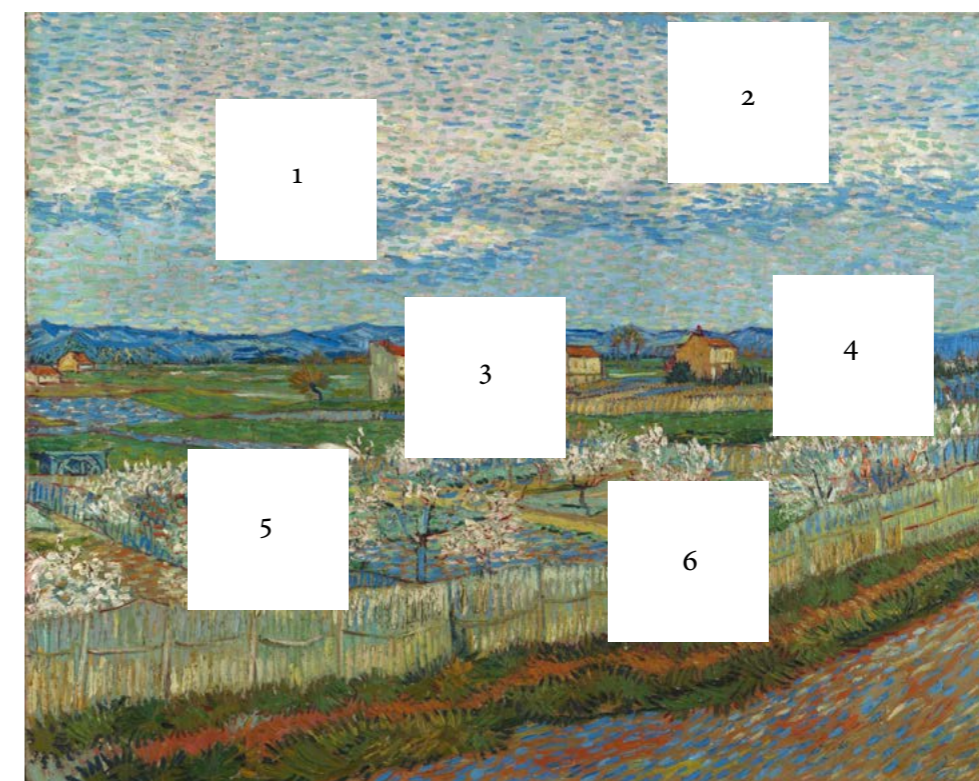
Vincent van Gogh, Kwitnące brzoskwinie, 1889 r.