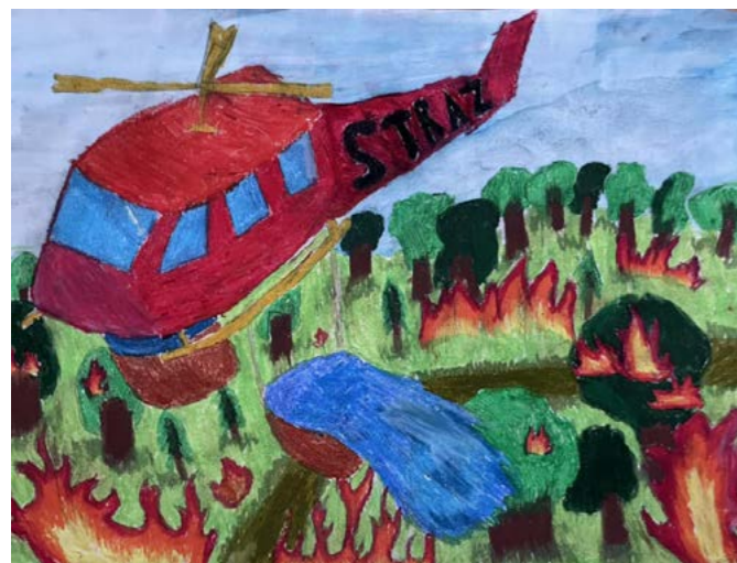
Jedna z nagrodzonych prac plastycznych

Wśród nagrodzonych i wyróżnionych znaleźli się także mieszkańcy gminy Goleszów, których kreatywne podejście do tematu zyskało uznanie niemal w każdej kategorii wiekowej. Teraz ich interpretacja tematu przewodniego, który brzmiał „Strażacy chronią lasy – lasy chronią klimat! Jestem odpowiedzialny z natury, czuję klimat”, zostanie zaprezentowana podczas wojewódzkiego etapu konkursu.