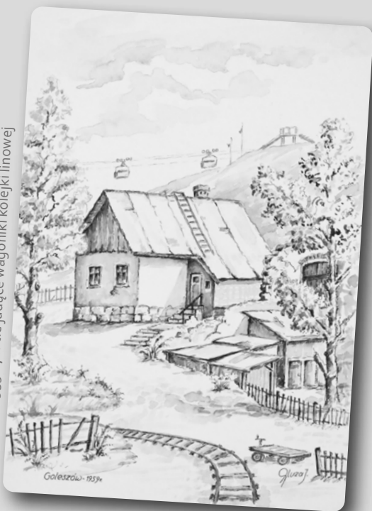
Domostwo z 1959 r., w tle jadące wagoniki kolejki linowej