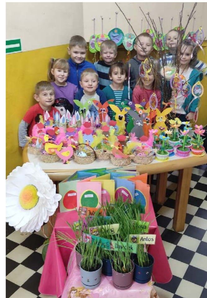
Przedszkolaki z Kisielowa w oczekiwaniu na wiosnę

Po odegranych jasełkach i po przedstawieniu z okazji Dnia Babci i Dziadka dzieci z przedszkola w Kisielowie tym razem przyjęły rolę widzów. Dnia 8 marca pojechały do Ustronia na przedstawienie teatralne pt. Dorotka w krainie Oz . Duża scena, barwne stroje, a dla dzieci zarezerwowany cały pierwszy rząd – wszystko to sprawiło, że pojawiły się zaniepokojenie, radość, a dzień, choć pochmurny, nabrał barw i obfitował w dobre doświadczenia.