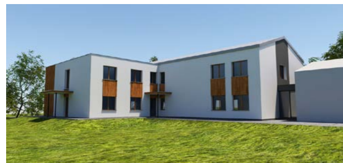
Wizualizacja – wstępna koncepcja rozbudowy ośrodka PSONI

Plany dotyczące oficjalnego otwarcia i przedstawienia mieszkańcom gminy Goleszów oferty Ośrodka Rehabilitacyjno-Edukacyjno-Wychowawczego w Bażanowicach pokrzyżowała pandemia koronawirusa. Czy może Pani zatem nakreślić, czym dokładnie zajmuje się bażanowicki ośrodek?