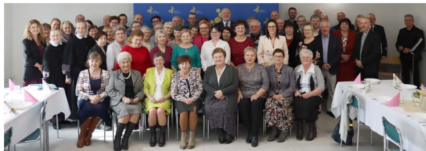
Otwarcie klubu seniora w Dzięgielowie

Ministerstwo Rodziny i Polityki Społecznej dofinansuje także codzienne funkcjonowanie klubów seniora działających w Bażanowicach, Cisownicy i Dzięgielowie. W tych trzech placówkach pozyskana kwota – łącznie 58 tys. zł – zostanie przeznaczona m.in. na prowadzenie terapii zajęciowej oraz zajęć relaksacyjno-gimnastycznych i manualnych, a ponadto umożliwi korzystanie z poradnictwa psychologicznego i dietetycznego, jak również z zajęć wspomagających aktywizację fizyczną seniorów.