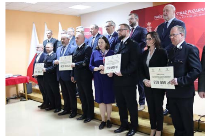
Wręczenie promes na zakup nowych wozów strażackich dla OSP